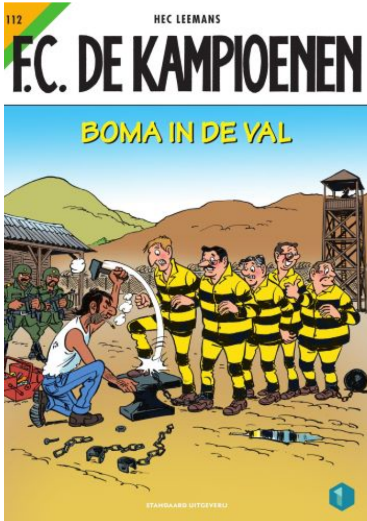
F.C. De Kampioenen - 112 Boma in de

Voor de talrijke stripfans zijn er weer 2 nieuwe en vooral leuke strips verschenen: