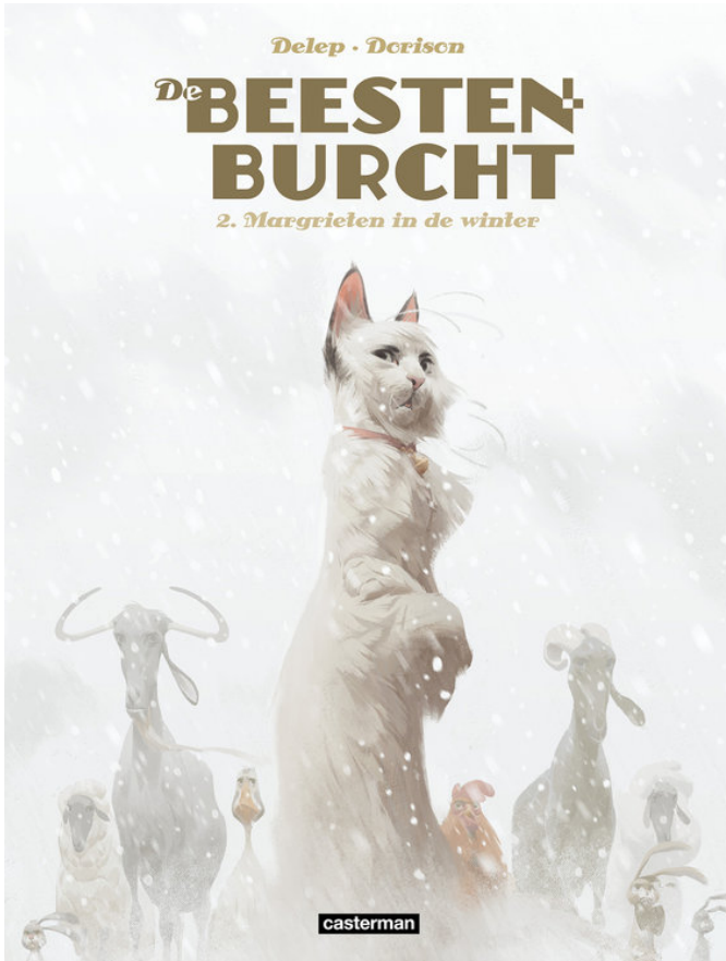
De Beestenburcht 2 - Margrieten in de winter