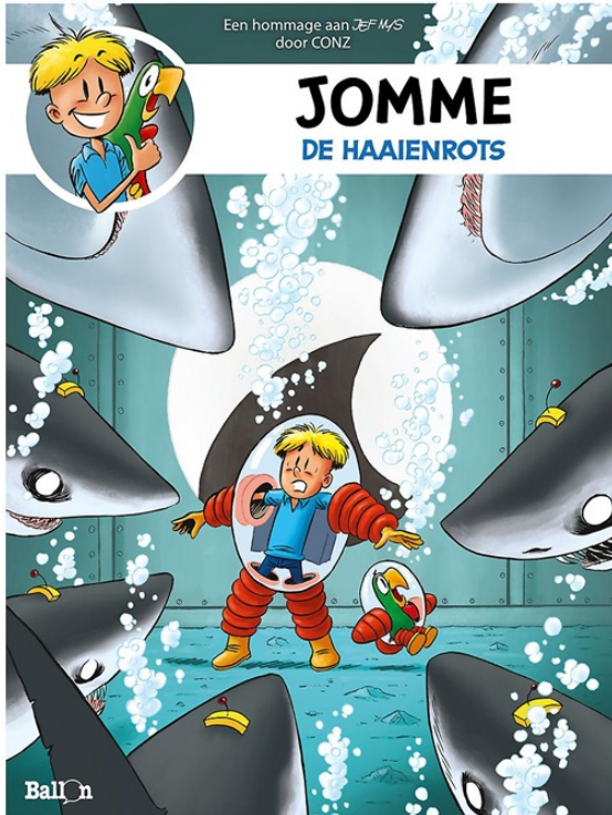
Jomme - De Haaienrots door CONZ

Voor elk wat wils, dus ideaal om zelf te lezen of om - ondanks de kerst beperkingen - geschenk te doen aan een familielid of vriend!